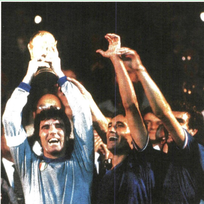
Trionfo Dino Zoff solleva la coppa al Santiago Bernabeu